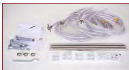
Zubehör für Heißgetränkegeräte

Reinigung: Die Reinigung im Betrieb muss gemäß DIN 6650-6 bei alkoholhaltigen Heißgetränken alle 7-14 Tage mit OTHG fit PROFI Reinigungsmittel sowie bei eisweißhaltigen Getränken täglich mit OTHG fit PROFI Reinigungsmittel erfolgen. Weitere Hinweise finden Sie in der Bedienungsanleitung der jeweiligen Geräteausführung.