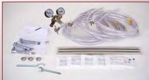
Zubehör für Heißgetränkegeräte mit gasbetriebenen Pumpen