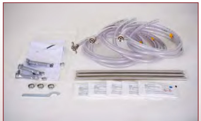
Zubehör von Gerät mit elektrischen Getränkepumpen