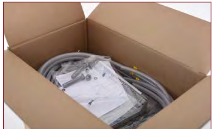
Alles für den reibungslosen Betrieb: Gerät unten im Karton, Zubehör liegt oben auf