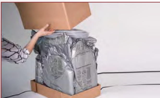
Müheloses Auspacken von Gerät und Zubehör, da sich die Kartonhaube ganz einfach nach oben abziehen lässt