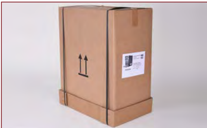
Gut geschützt, sicher verpackt - die Paket-Versionen unserer Heißgetränkegeräte

Wir bieten unsere Heißgetränkegeräte im praktischen „Komplett-Paket“ an. Das heißt, alle benötigten Zubehörteile sind mit dabei. Die Paketversion ist günstiger als der Kauf einzelner Zubehörteile. Gerne können Sie bei uns aber auch die Geräte ohne Zubehör anfragen.