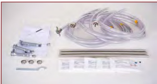
Zubehör für Heißgetränkegeräte mit elektrischen Pumpen

Unsere Geräte mit gasbetriebenen Gerätepumpen benötigen für die Getränkeförderung zusätzlich CO 2 , Druckluft oder Stickstoff. Die Leitungslänge darf hier dann bis maximal 10 Meter betragen, der Höhenunterschied maximal 3 Meter.